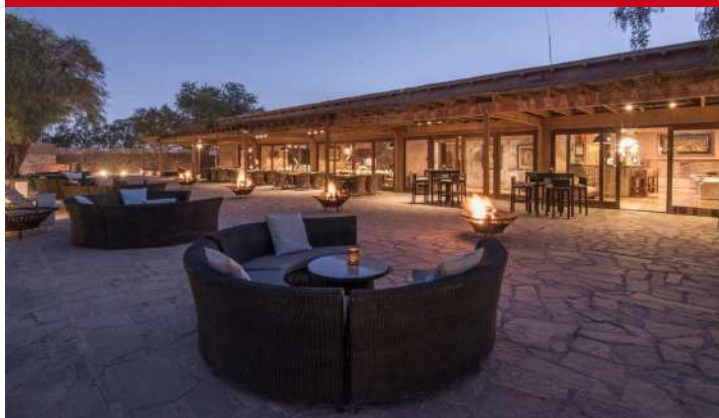
Cumbres San Pedro de Atacama