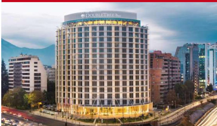
Double Tree Santiago Kennedy