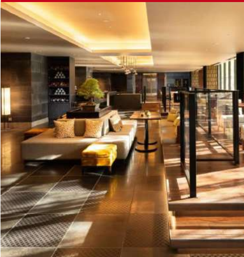
Double Tree Kyoto Station