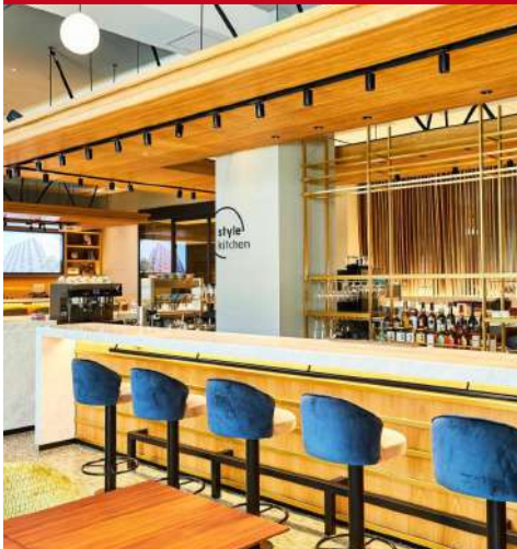
Nikko Style Nagoya