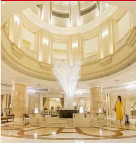
Grand Nikko Tokyo