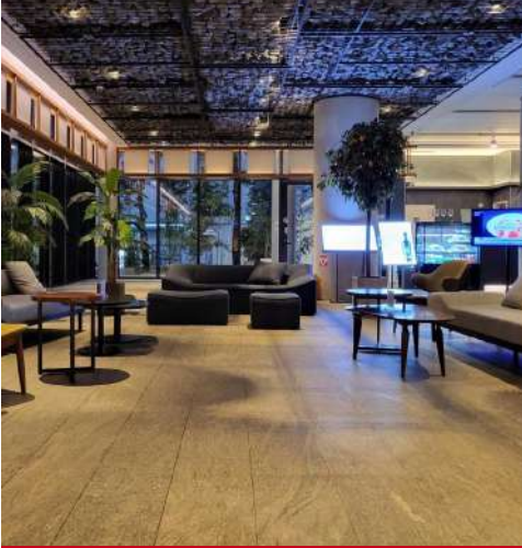
Sotetsu Splaisir Myeongdong