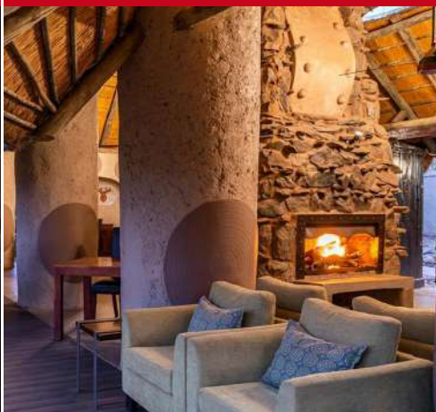
Makalali Main Lodge