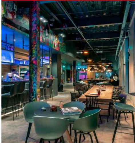
Moxy Merchant City