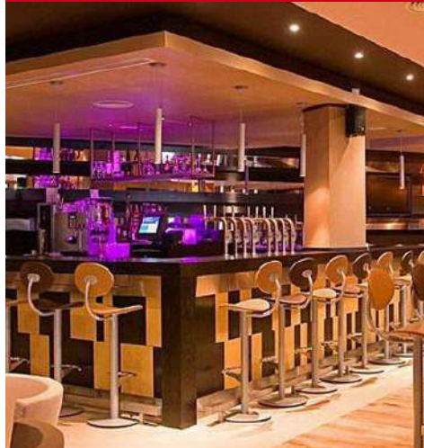
Maldron Hotel Limerick