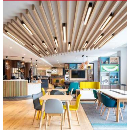
Holiday Inn Belfast