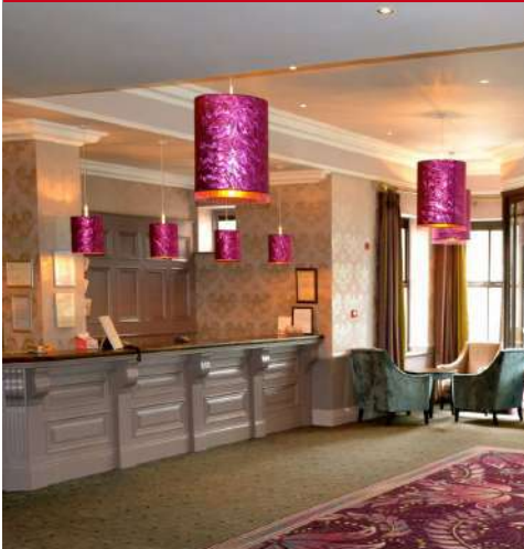
Maldron Hotel Oranmore