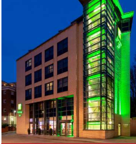
Holiday Inn York