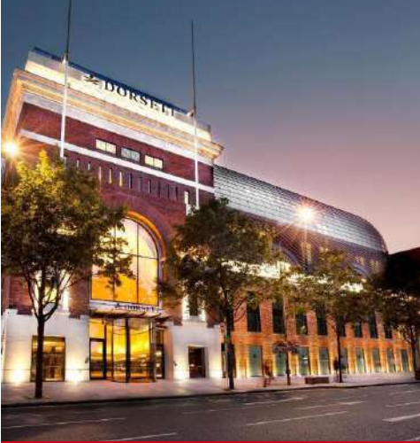
Dorsett Shepherd's Bush