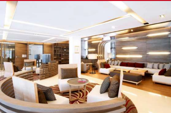
Classic Kameo Ayuthaya