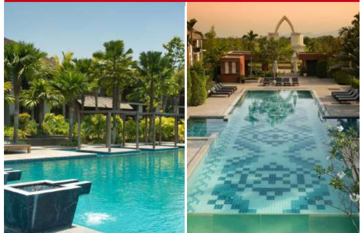
Patara Phitsanuloke ou Sukhothai Treasure