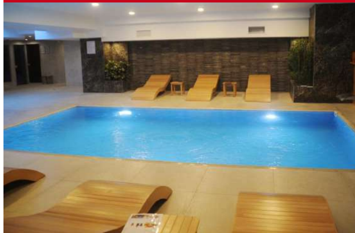
Hotel Kordon Çankaya