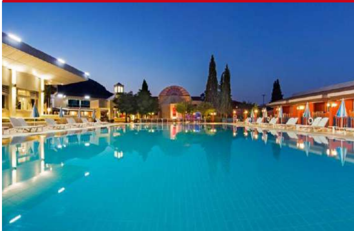
Hotel Colossae Thermal