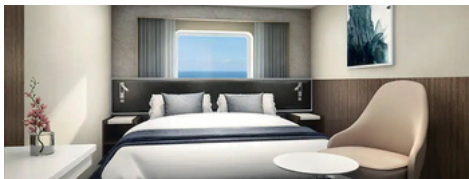
Cabine Externa com Janela