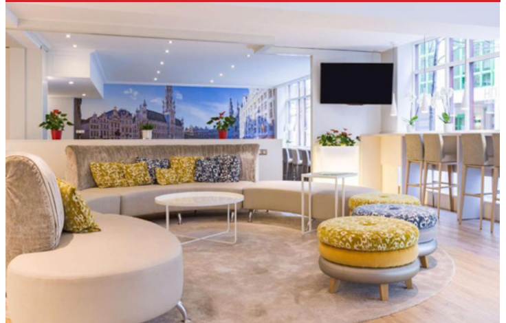
NH Grand Palace Arenberg