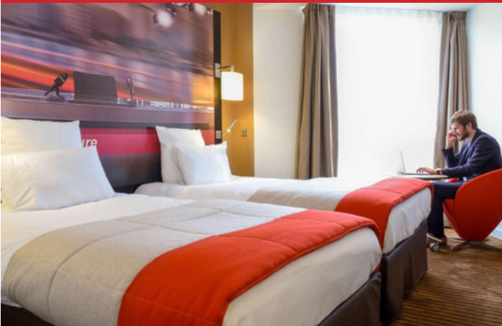
Mercure Paris Boulogne