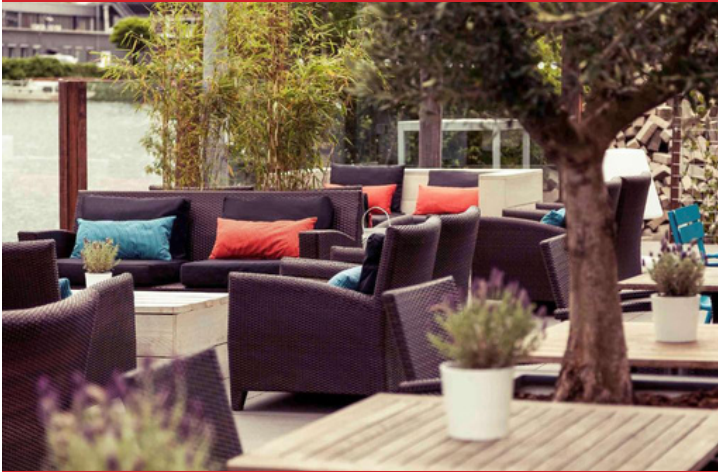
Mercure Amsterdam City