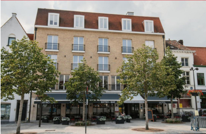
Le Bois de Bruges