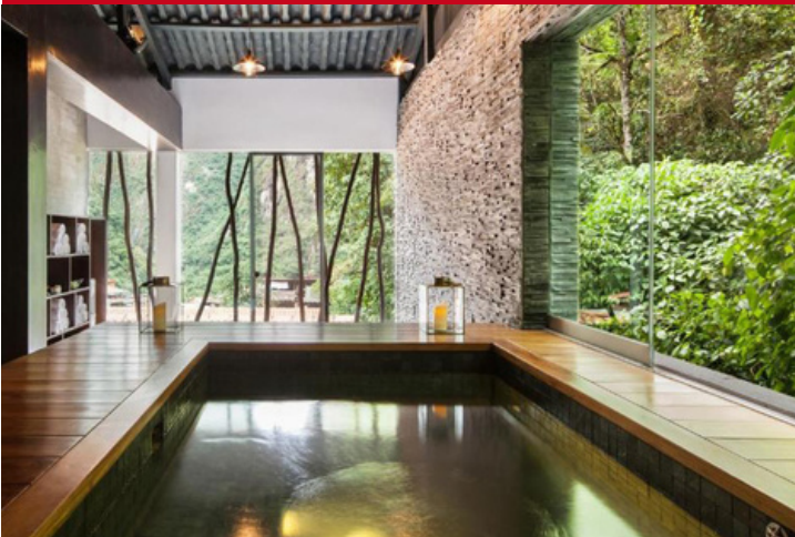
Hotel Inkaterra el Mapi