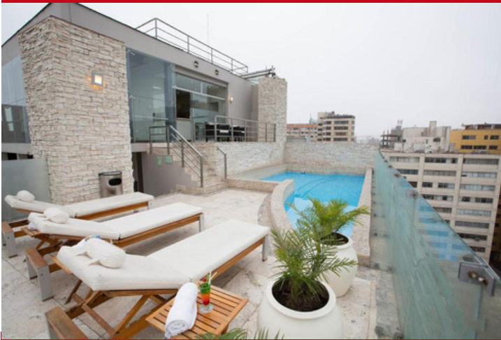
Hotel Sol de Oro