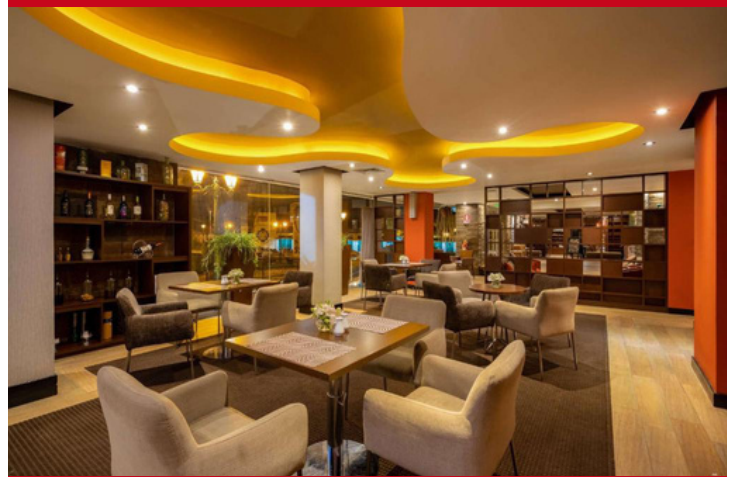
Sonesta Hotel Cusco