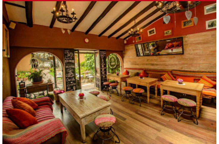
Sonesta Posada del Inka Yukai