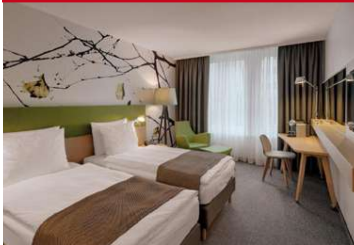
Holiday Inn Frankfurt Alte