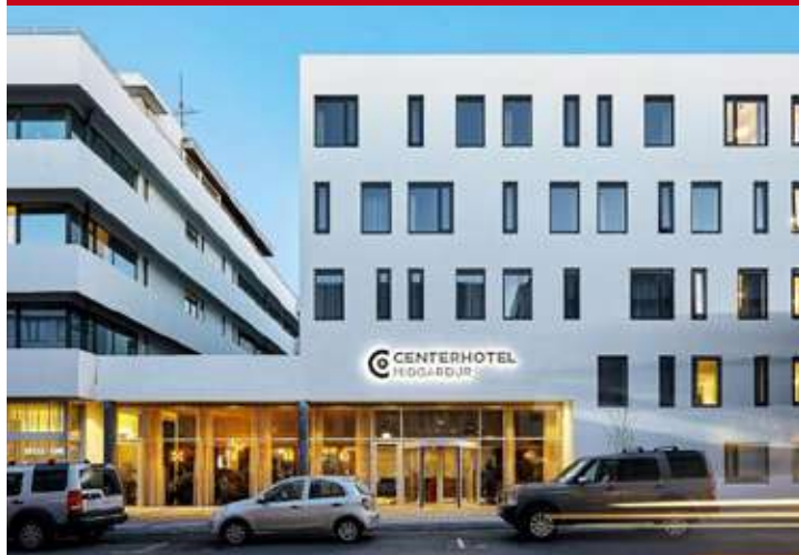
Midgardur by Center