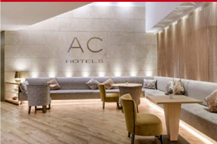
AC Genova Centro