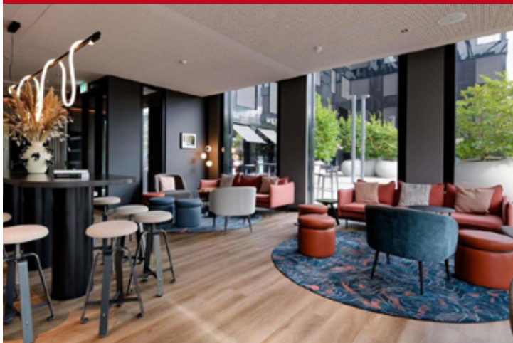
Mercure Zurich City