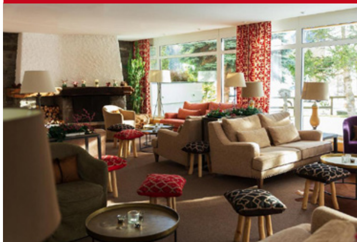
Europa St. Moritz